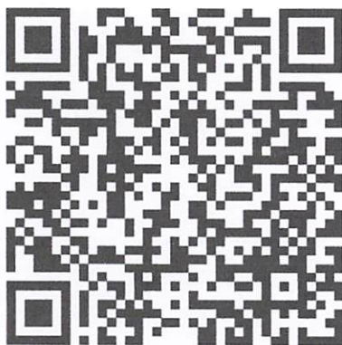
Template สำหรับการประชาสัมพันธ์ เสริมสร้างภาพลักษณ์องค์กร ในโปรแกรม Canva ของสำนักงาน พัฒนาชุมชนจังหวัดฉะเชิงเทรา