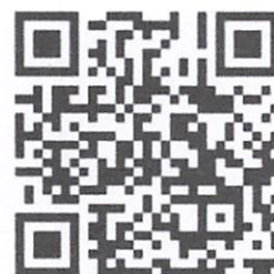
กลุ่มพัฒนากร พี่เลี้ยง น้องเลี้ยง ก้าวไปด้วยกัน พี่น้องพัฒนากร