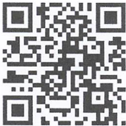
สอนวิธีใช้ CANVA ตั้งแต่ต้น-จนจบ สำหรับมือใหม่