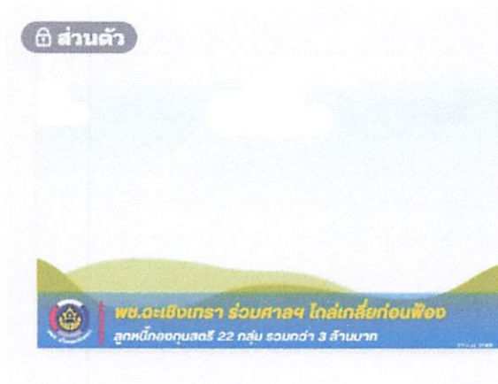
Templateข่าวรูปแบบใหม่

1080 x 720 px • แก้ไขแล้ว ไม่เกินวันที่ผ่านมา