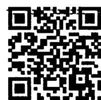
กลุ่มเป้าหมาย