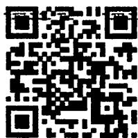
แบบสอบถาม