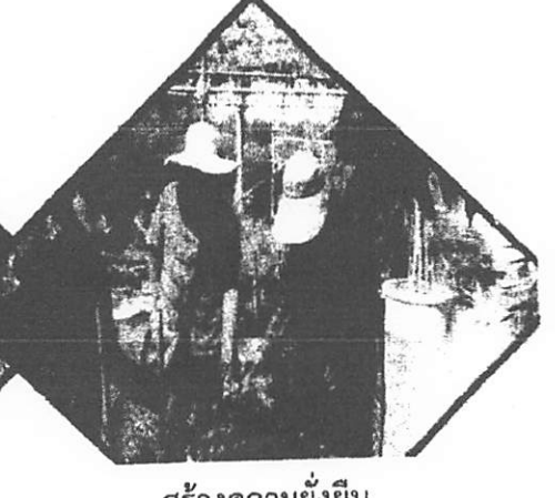
สร้างความยั่งยืน