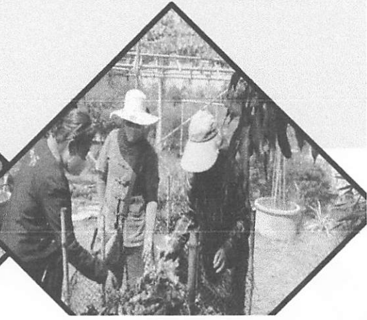
สร้างความยั่งยืน