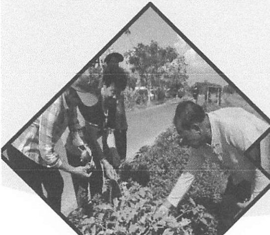
สร้างความมั่นคง

กิจกรรมย่อยที่ ๘.๒ จัดเวทีแลกเปลี่ยนบทเรียนความสำเร็จผู้นำการเปลี่ยนแปลง (ระดับอำเภอ)