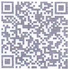
สิ่งที่ส่งมาด้วย

พัฒนาการจังหวัด ปฏิบัติราชการแทน ผู้ว่าราชการจังหวัดฉะเชิงเทรา