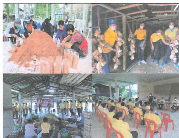
ภาพ : ภาพกิจกรรมในชุมชน

เสียงบรรยาย : “ศูนย์รวมเห็ดเศรษฐกิจสู่ผลิตภัณฑ์ชุมชน สร้างคน สร้างงาน สร้างอาชีพ” เกิดจากการระดมทุนของคนในหมู่บ้าน ร่วมกันจัดทำฐานการเรียนรู้ ประกอบอาชีพ ได้แก่ 1. ฐานการทำก้อนเชื้อเห็ด 2. ฐานการเพาะเห็ดนางฟ้า 3. ฐานการเพาะเห็ดหูหนู 4. ฐานการแปรรูปเห็ด 5. ฐานการทำปุ๋ยหมักจากก้อนเชื้อเห็ด ส่งผลให้เกิดการเรียนรู้ สามารถนำไปสู่การฝึกอาชีพ จนเกิดความชำนาญ นำไปประยุกต์ใช้เพื่อสร้างรายได้ให้แก่ครัวเรือนของตนเอง