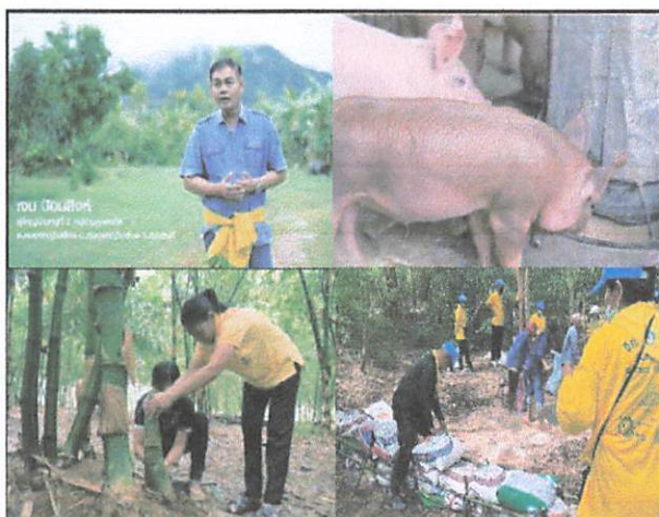
ภาพ : ผู้นำชุมชน,ปราชญ์ชุมชน ให้สัมภาษณ์,ประมวลภาพกิจกรรม