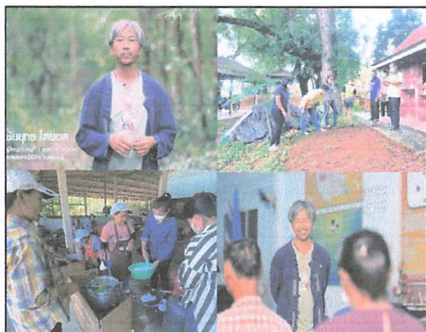
ภาพ : ผู้นำชุมชน,ปราชญ์ชุมชน ให้สัมภาษณ์,ประมวลภาพกิจกรรม