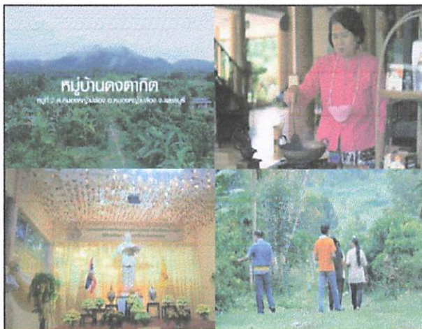
ภาพ : บรรยากาศ,กิจกรรมของหมู่บ้าน

Super : บ้านวังปลับ หมู่ที่ 11 ตำบลท่าคอย อำเภอท่ายาง จังหวัดเพชรบุรี (ด้านสิ่งแวดล้อม)