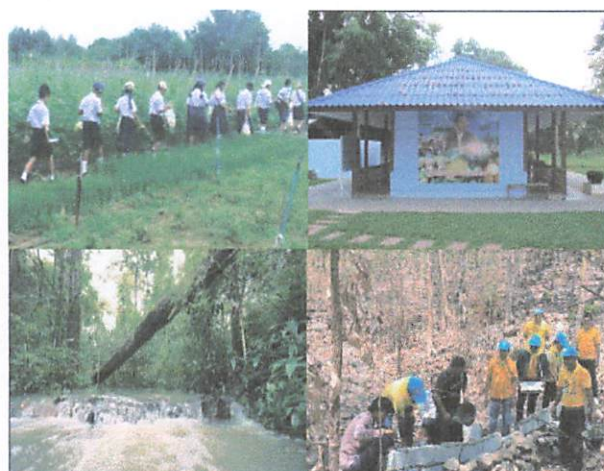
ภาพ : ภาพกิจกรรมในชุมชน

เสียงบรรยาย : กิจกรรมสร้างฝายชั่วคราว (ฝายแม้ว) ฝายกึ่งถาวร เพื่อเก็บกักน้ำ และชะลอความแรงของน้ำ เป็นการเพิ่มประสิทธิภาพของการบริหารจัดการน้ำ ส่งผลให้ทรัพยากรธรรมชาติมีความอุดมสมบูรณ์ ประชาชนสามารถประกอบอาชีพเกษตรกรรมได้ดีขึ้น