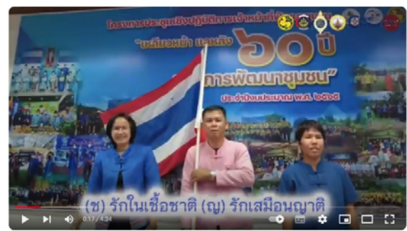
เพลง มารัฐพัฒนาชุมชน จังหวัดฉะเชิงเทรา Master (2566)