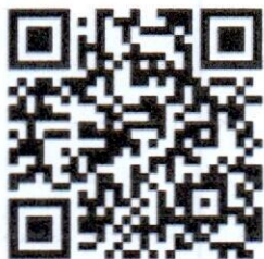
แบบสอบถาม