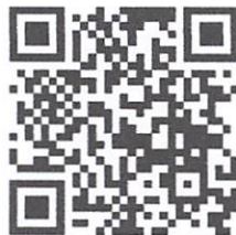
(สรุปผลการดำเนินงานขจัดความยากจนฯ)