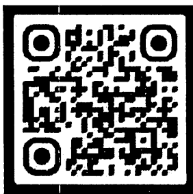
แบบทดสอบก่อนการฝึกอบรม

ผู้เข้าร่วมการอบรมฯ สามารถประเมินผลการเรียนรู้ทั้งก่อนและหลังการฝึกอบรม (แบบทดสอบก่อนและหลังเรียน) ผ่าน QR Code รายละเอียด มีดังนี้