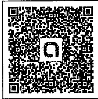
โครงการเพิ่มประสิทธิภาพการตรวจสอบภายในเบื้องต้น

ผู้เข้าร่วมอบรมฯ สามารถสแกน QR Code ของกลุ่ม Line "โครงการเพิ่มประสิทธิภาพการตรวจสอบภายในเบื้องต้น" ตามรูปที่ปรากฏ เพื่อติดต่อสอบถามข้อมูลเกี่ยวกับการดำเนินงานโครงการฯ