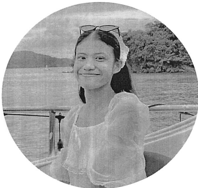
ผู้ประสานงานหลักทีม E