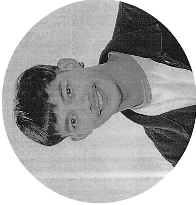
ผู้ประสานงานหลักทีม C