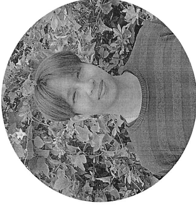
ผู้ประสานงานหลักทีม C