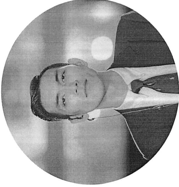
ผู้ประสานงานหลักทีม B