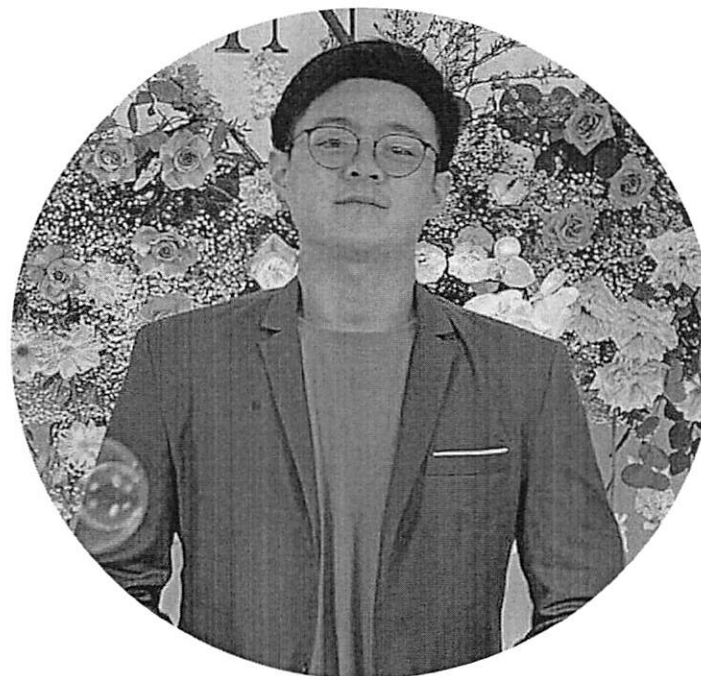
ผู้ประสานงานหลักทีม E