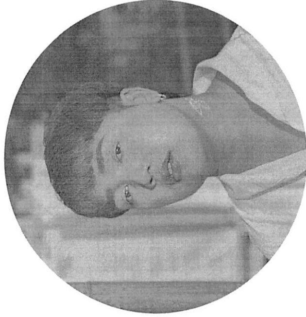
ผู้ประสานงานหลักทีม B