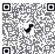
(เอกสารแนบ ๑๖)

(๑) ผลการบริหารจัดการหนี้จังหวัดฉะเชิงเทรา ปีงบประมาณ ๒๕๕๖ – ๒๕๖๖