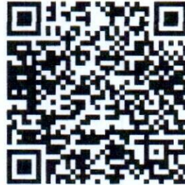
QR Code รายงานผลความก้าวหน้า

๒.๑ รายงานผลความก้าวหน้าการดำเนินโครงการฯ ทั้งนี้ที่ดำเนินการแล้วเสร็จ หรือเมื่อ ข้อมูลมีการเปลี่ยนแปลงในระบบ Google Drive แบบ Real – time