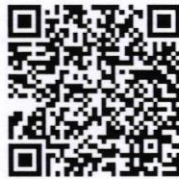
(เอกสารแนบ ๕)

กรมการพัฒนาชุมชน แจ้างแนวทางการดำเนินงานโครงการพัฒนาพื้นที่ต้นแบบการพัฒนาคุณภาพชีวิตตามหลักทฤษฎีใหม่ประยุกต์สู่ “โคก หนอง นา โมเดล” (ปีงบประมาณ พ.ศ. ๒๕๖๕ - ๒๕๖๘) และเกณฑ์การประเมินศักยภาพพื้นที่ต้นแบบการพัฒนาคุณภาพชีวิตตามหลักทฤษฎีใหม่ ประยุกต์สู่ “โคก หนอง นา โมเดล”