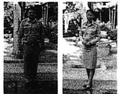
ชุดเครื่องแบบข้าราชการ