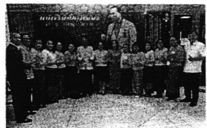
ชุดผ้าไทย