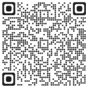
กรณีนับเงินกู้ฯ