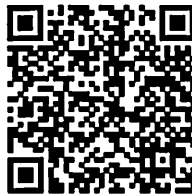
(เอกสารแนบ ๘)

(๒) ประกาศคณะกรรมการบริหารกองทุนพัฒนาบทบาทสตรี เรื่อง หลักเกณฑ์ วิธีการ และเงื่อนไขเกี่ยวกับการลดอัตราดอกเบี้ยเงินกู้และอัตราดอกเบี้ยผิดนัดกองทุนพัฒนาบทบาทสตรี พ.ศ. ๒๕๖๓ (ฉบับที่ ๓) ตั้งแต่วันที่ ๒๗ พฤศจิกายน ๒๕๖๓ ถึงวันที่ ๒๖ มีนาคม ๒๕๖๔ (ระยะเวลา ๑๒๐ วัน) มีสมาชิกยื่นความประสงค์ปรับโครงสร้างหนี้และลดอัตราดอกเบี้ยผิดนัด จำนวน ๔๘ โครงการ เป็นเงิน ๕,๗๓๘,๕๑๘.๓๕ บาท