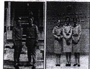
ชุดเครื่องแบบข้าราชการสีกากีแขนยาว