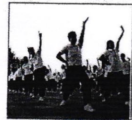
ชุดออกกำลังกาย