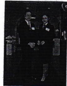
เครื่องแบบ/ชุดระหว่างฝึกอบรม

ตัวอย่างการแต่งกายของผู้เข้ารับการฝึกอบรม