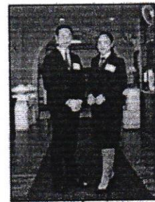
เครื่องแบบ/ชุดระหว่างฝึกอบรม