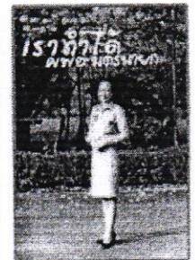
ชุดเครื่องแบบข้าราชการสีทากีแขนยาว