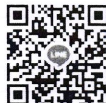
นบพ.รุ่นที่ ๓/๖๒