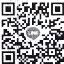
นบพ.รุ่นที่ ๑/๖๒