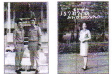
ชุดเครื่องแบบข้าราชการสีทากี๊แขนยาว