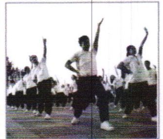
ชุดออกกำลังกาย