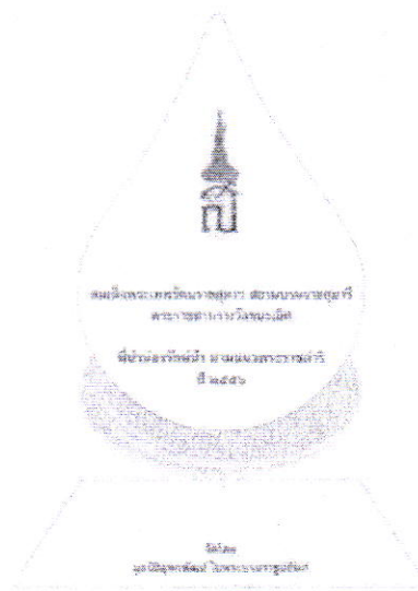
ภาพตัวอย่างโล่รางวัลพระราชทาน

รางวัลชนะเลิศ โล่พระราชทานจากสมเด็จพระเทพรัตนราชสุดาฯ สยามบรมราชกุมารี พร้อมเกียรติบัตรแสดงความยินดี และเงินรางวัล จำนวน 50,000 บาท (จำนวน 1 รางวัล)