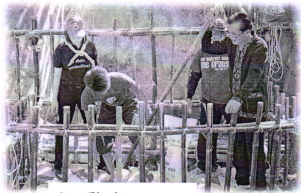
คิวอาร์โค้ด ผู้ประสานงาน